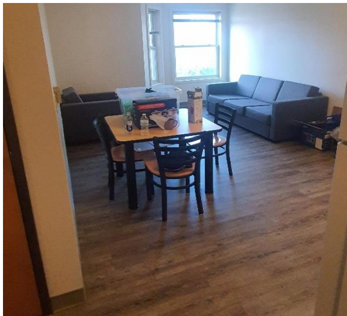
A képeken a szobám és a „lakásunk” látható

Mindegyik gyakornok nagyon kedves, és mivel alig van olyan, aki helybéli, mindannyian fel akarjuk fedezni a környéket. Voltunk kempingezni a Nagy-tavak Városában, Traverse Cityben. Ellátogattunk Chicagoba is, ami hatalmas élmény volt. Bár zöldterületből kevés akadt, mégis összességében magával ragadó volt a látvány. Az óriási épületek miatt, alig tudtunk a lábunk elé nézni, mert csak azt figyeltük, milyen magasak az iroda/lakóházak. Ellátogattunk a „Bean”-hez, ami egy bab formájú építmény, mely egyfajta nagy tükörként funkcionál. Furcsa módon ezt mondják Chicago egyik legnagyobb látványosságának, a souvenir boltok tele vannak az ezzel kapcsolatos kacatokkal.